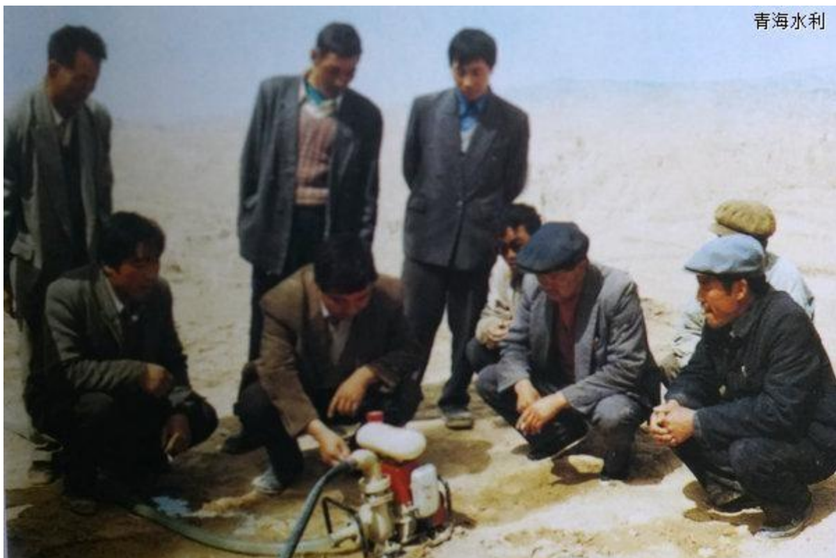
我们经常下乡指导技术