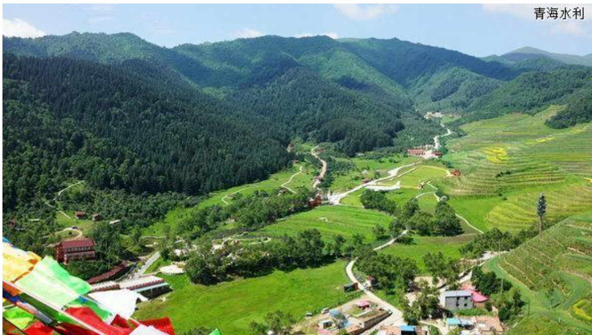
昔日贫困山村今日旅游景区，湟中县卡阳村依靠水保生态在乡村振兴中“脱颖而出”