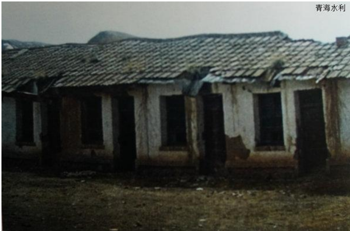
基层条件很差，这是化隆县甘都水管所旧貌