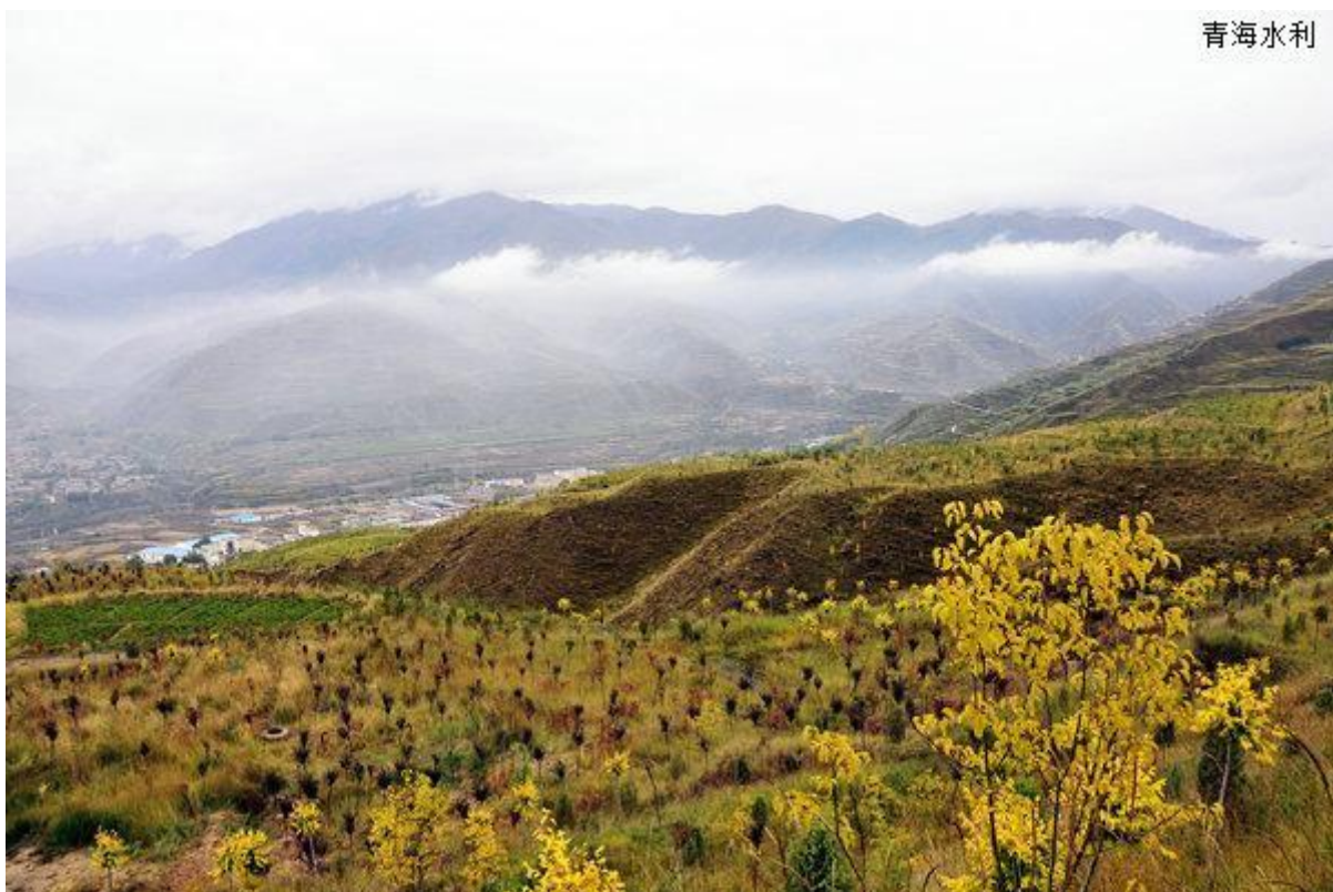
昔日难治理的黄南州难当山今日也成了七彩的绿色屏障