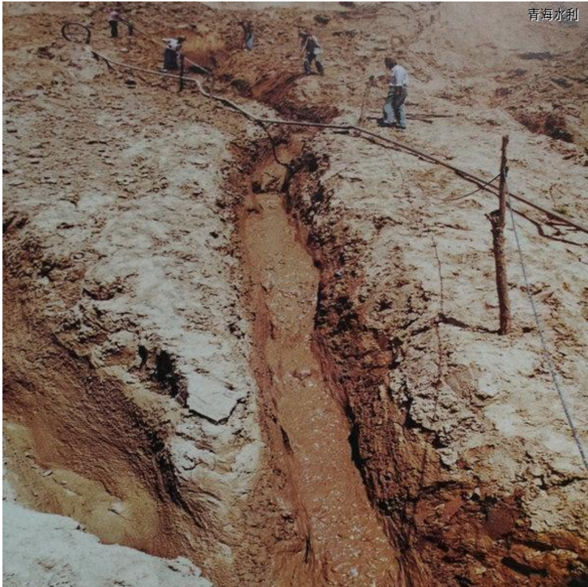
那时候我们用的是水坠坝技术