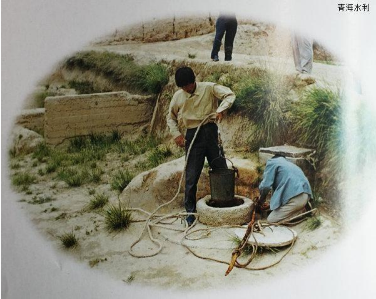
还记得雨水集流窖吧，也是没办法的办法。那时人饮安全还得不到有效保障。