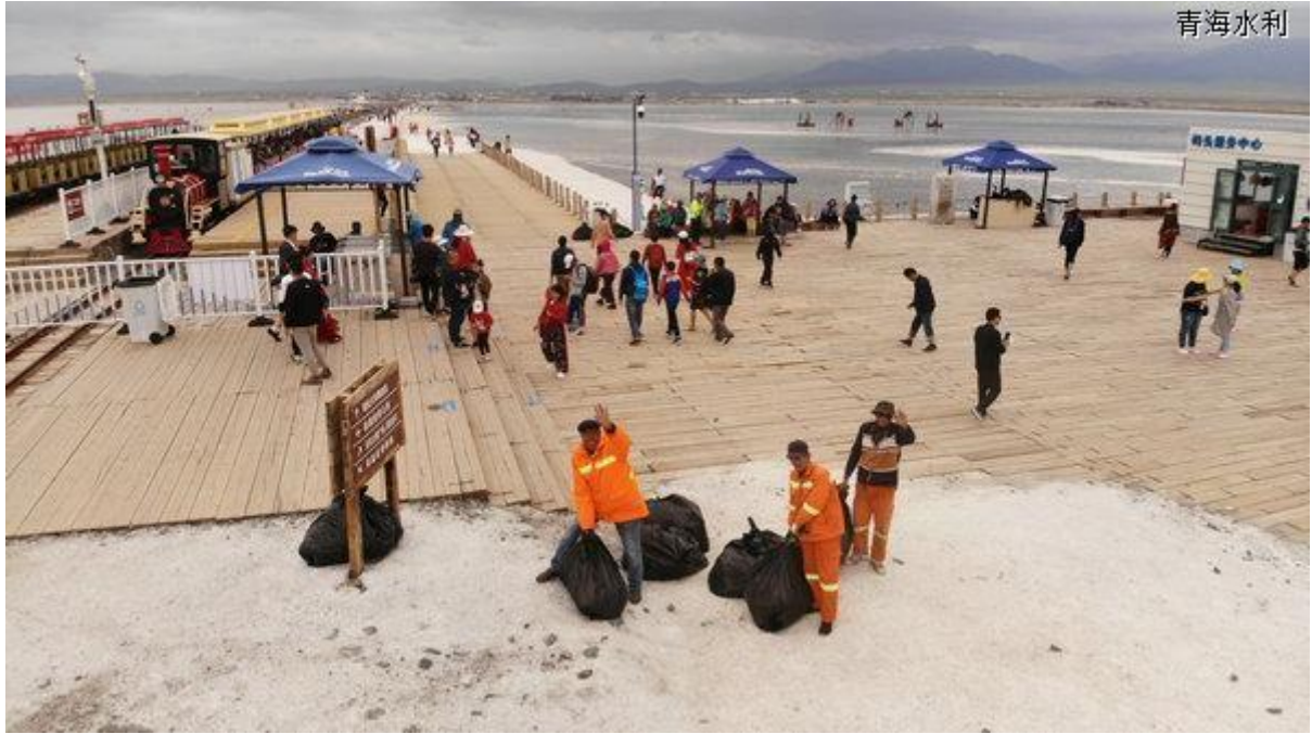
现在我们除了大江大河连盐湖都有了河湖长