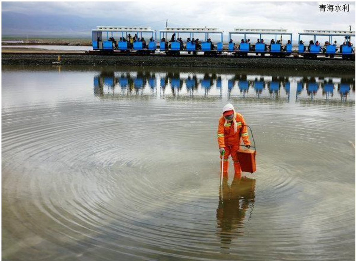
处处都是最美丽的倒影