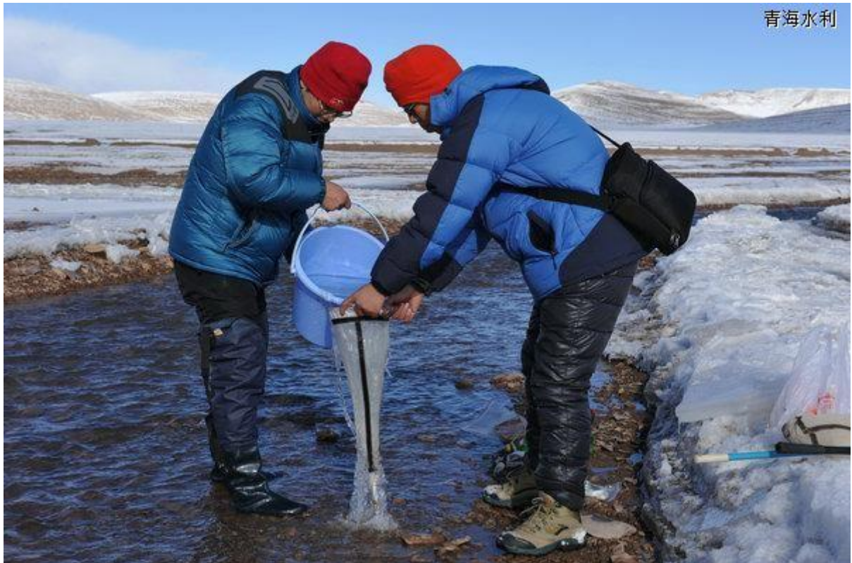
三江源考察逐步深入