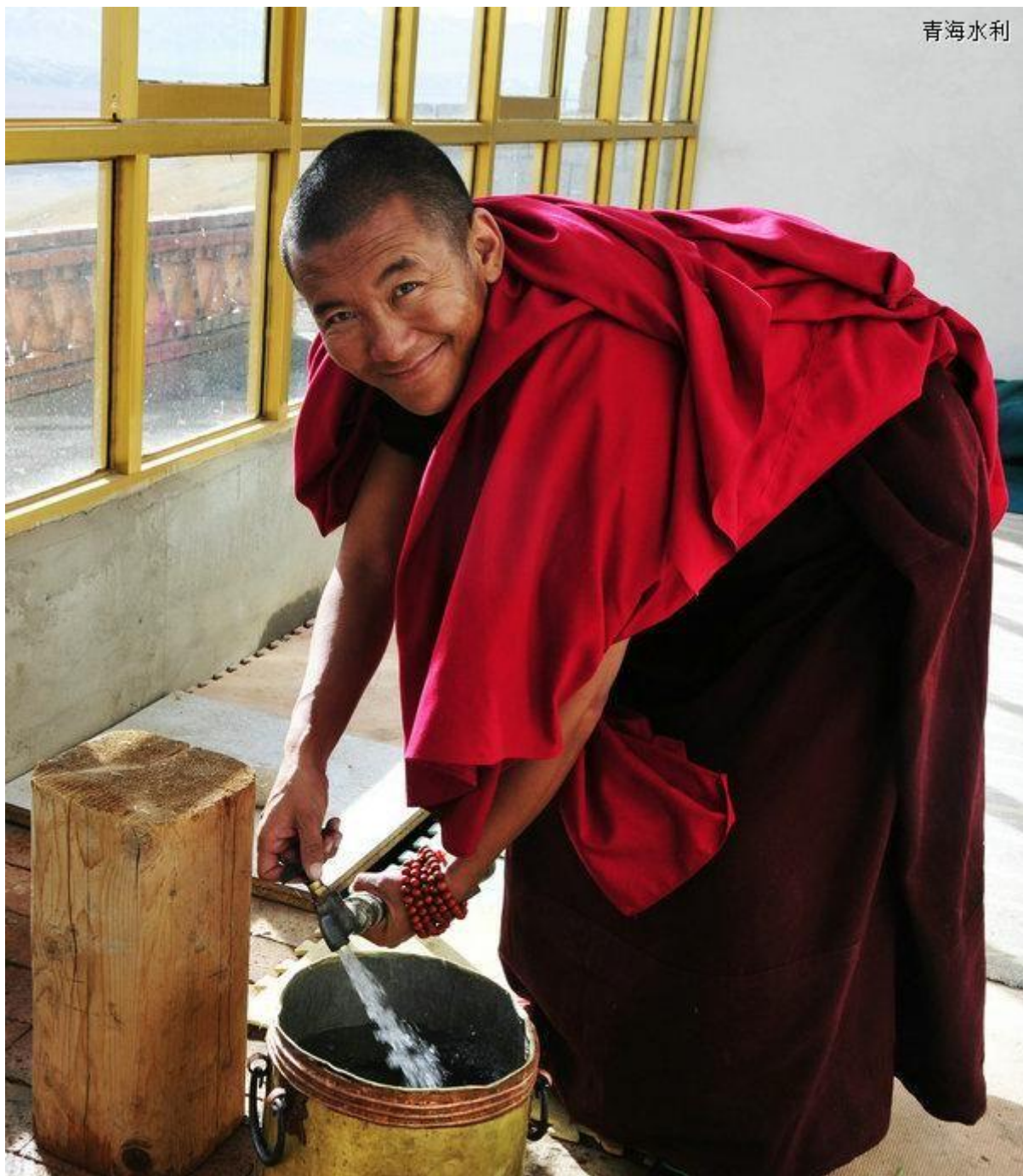
如今我们已实现了村村通，户户通。包括边远的寺院。