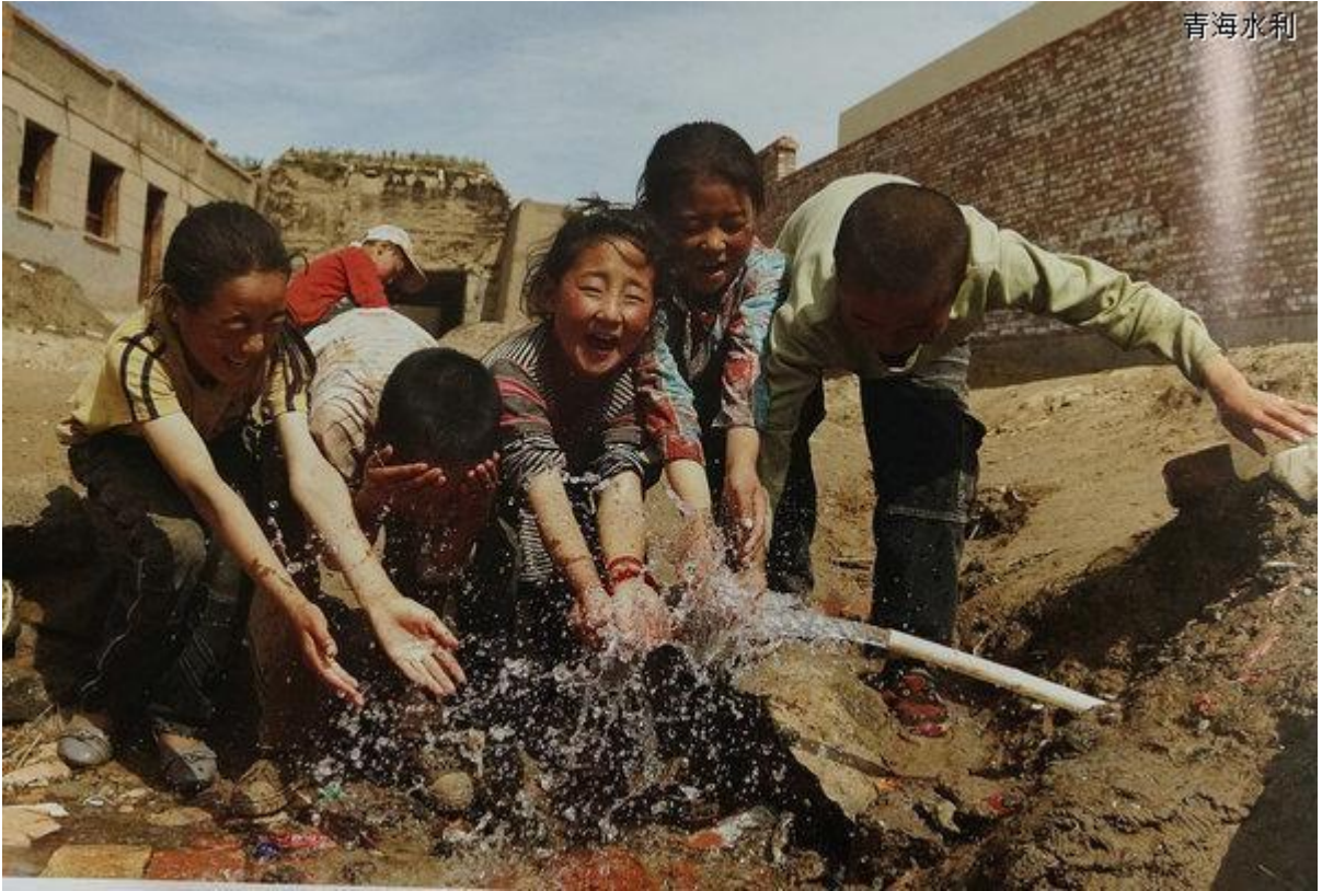
那时候，自来水通到家门口已经让山村的孩子兴奋不已。