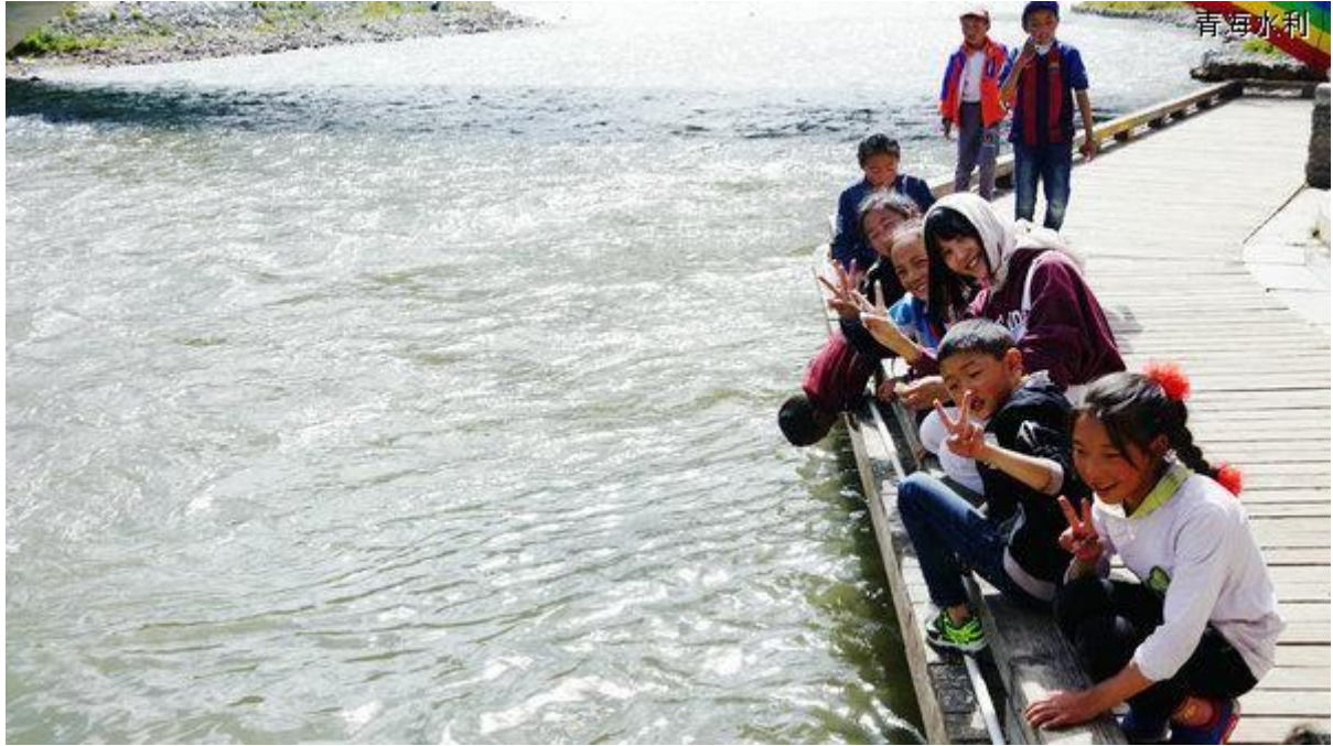
山清水秀欢声笑语